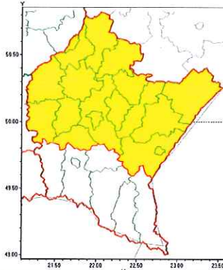
Silny wiatr 2022-01-31 00:05